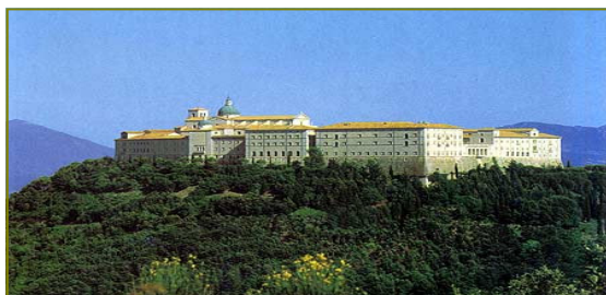
La storia e la cultura: Monte Cassino, Roma, Subiaco